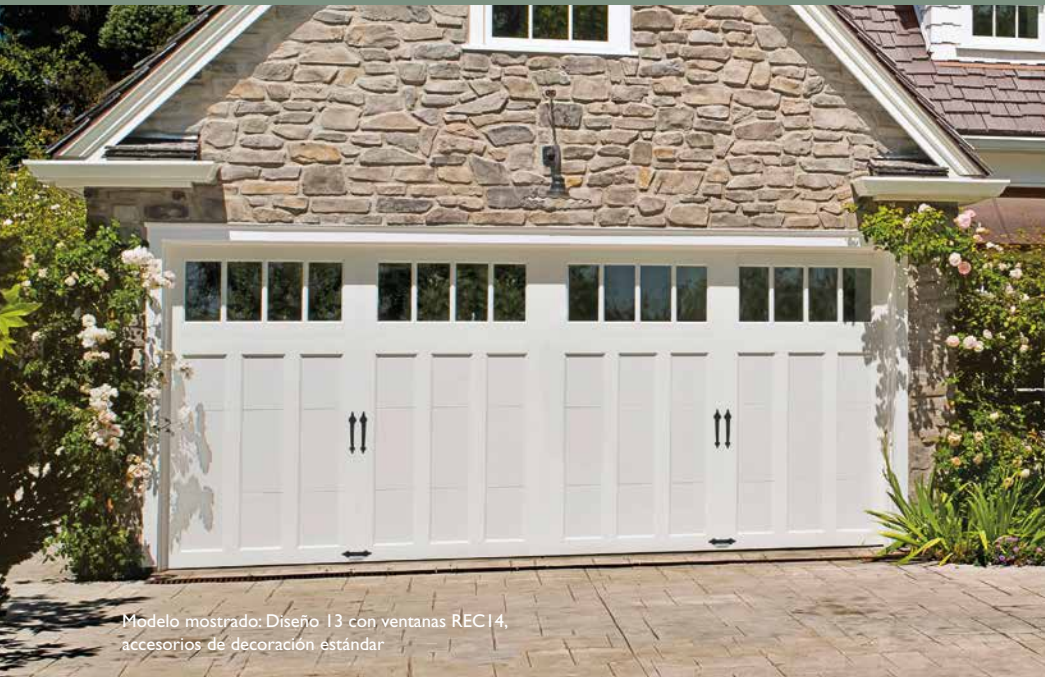
Modelo mostrado: Diseño 13 con ventanas REC14, accesorios de decoración estándar