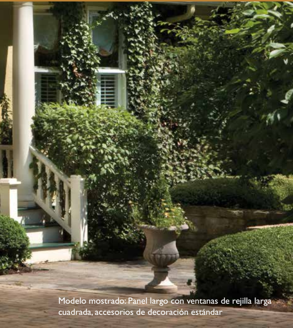
Modelo mostrado: Panel largo con ventanas de rejilla larga cuadrada, accesorios de decoración estándar